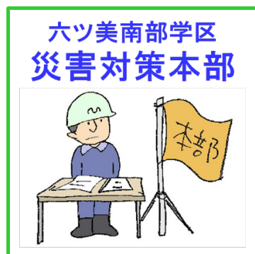
指定避難所関連ステッカ